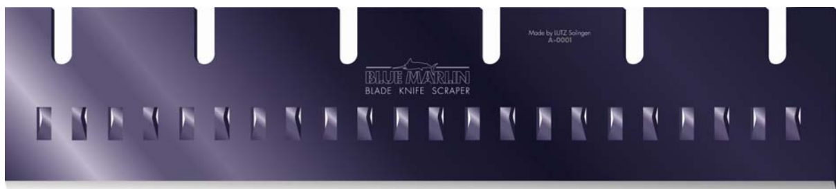
Stripper Klinge 35 cm