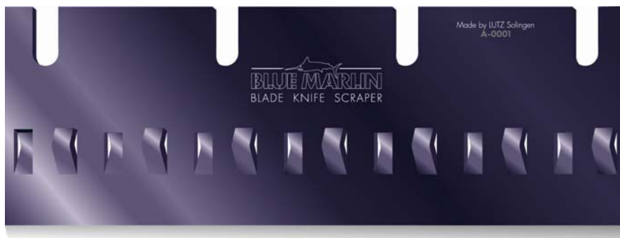
Stripper Klinge 21 cm