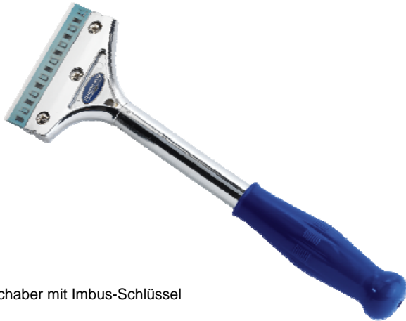
Schaber mit Imbus-Schlüssel