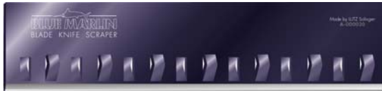
Schaber Klinge 10 cm

durch den Bläuungsprozess entstandene Oxide verschiedener Zusammensetzung und Stärke, die Klinge vor Korrosion. Darüber hinaus verfolgt Profloor Technologies ihr weltweit einzigartiges Konzept, die Klingen zu nummerieren, auch bei den Klingen für die Scraper. So kann der Produktionsweg jeder einzelnen Klinge genau nachvollzogen und die am Markt renommierte Top-Qualität jederzeit gesichert werden.