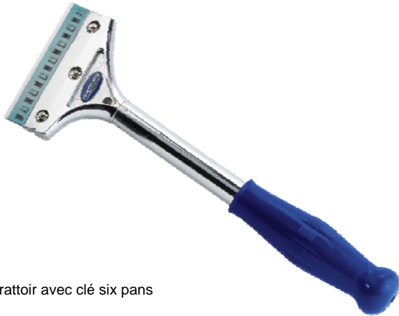
Grattoir avec clé six pans