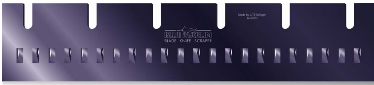
Lame pour décolleuse 35 cm