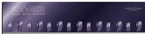
Lame pour grattoir 10 cm

En outre, Profloor Technology applique son concept unique au monde de numérotation des lames, même pour les lames destinées aux scrapers. On peut donc remonter avec précision la ligne de production jusqu'à chaque lame individuelle, et garantir en permanence la haute qualité qui fait la renommée de l'entreprise sur le marché.