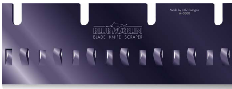
Lame pour décolleuse 21 cm